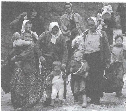
Evacuación de refugiados en la ciudad de Srebrenica (Bosnia) en abril de 1993. Las situaciones de guerra civil que se han multiplicado en las últimas décadas del siglo xx, han aumentado la cantidad de refugiados en diversas partes del globo. Privados de su país, su casa y, muchas veces, de su familia son uno de los sectores cuyos derechos humanos están siendo más violados en la actualidad. La ONU cuenta con programas especiales para su asistencia.

La ONU ratificó otros convenios para la protección de los seres humanos, como la Convención para la prevención y represión de los crímenes de genocidio (1948); las Convenciones de Ginebra en materia de derecho bélico (1949); la Convención sobre los derechos políticos de la mujer (1953); la Convención sobre la eliminación de todas las formas de discriminación racial (1965); la Convención sobre