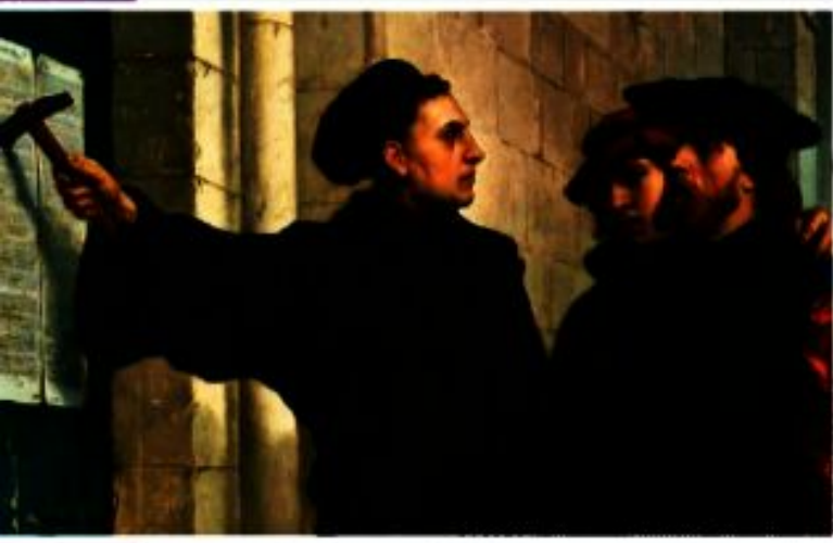
► Las "95 tesis" que Martín Lutero clavó en la puerta de una iglesia impulsaron la Reforma Protestante.

Para el constitucionalismo, las personas son, al mismo tiempo, individuos con derechos inherentes cuyo ejercicio no debe estar limitado por el Estado, y ciudadanos con derecho a participar en la vida política.