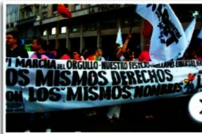
► "Los mismos derechos con los mismos nombres" fue el eslogan elegido por quienes se manifestaron a favor de la Ley de Matrimonio Igualitario.

Así, por ejemplo, en nuestro país la ley Sáenz Peña de 1912 estableció por primera vez aspectos del sufragio tal como lo conocemos ahora, pero reconoció el derecho al voto solo para los hombres. Esto fue ampliado recién en 1947, con la Ley de Voto Femenino . De igual forma, la legislación que regula los derechos de las familias y sus miembros sufrieron importantes cambios. En la Argentina, por ejemplo, la Ley de Matrimonio Igualitario, sancionada en 2010, permite el matrimonio entre personas del mismo sexo.