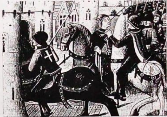
Juana de Arco al mando del ejército francés durante la Guerra de los Cien Años.

Como dice Eduardo III, en un principio, los ingleses obtuvieron grandes victorias gracias a la utilización de infantes armados con grandes arcos. Pero, más tarde, los franceses, acudidos por Juana de Arco , una campesina que decía seguir un mandato divino, lograron recuperarse y, finalmente, expulsaron a los ingleses.