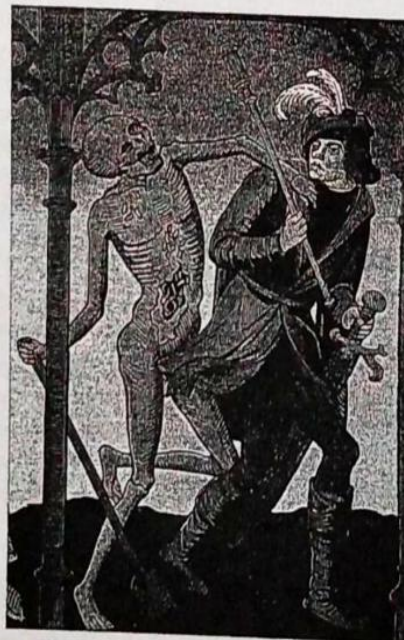
Ilustración del siglo XV que representa a la muerte tomando la vida de un burgués.

Ya que consideraban a la peste un castigo divino, las poblaciones, aterradas, rezaban oraciones, participaban de procesiones y se autoprovocaban castigos corporales para pedir perdón por sus pecados. También usaban piedras a modo de talismanes, tomaban medicamentos hechos con todo tipo de ingredientes y se dejaban practicar sangrías por los médicos y los curanderos de la época.