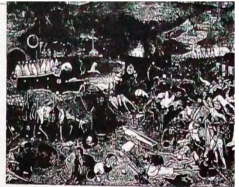
El título de esta pintura del siglo XVI de Pieter Bruegel ( El triunfo de la muerte ) podría ser una buena síntesis de lo que fue el siglo XIV.

A principios del siglo XIV, estalló en Europa una crisis generalizada, que se extendió hasta mediados del siglo XV. ¿Sabés por qué hablamos de crisis? Porque aquellos fueron años de hambrunas, epidemias, guerras, sublevaciones campesinas y motines urbanos que, en su conjunto, provocaron millones de muertos. El catastrófico descenso de la población redujo la mano de obra disponible, obligó a que gran cantidad de tierras quedaran sin cultivar y frenó la expansión económica que Europa experimentaba desde principios del siglo XI.