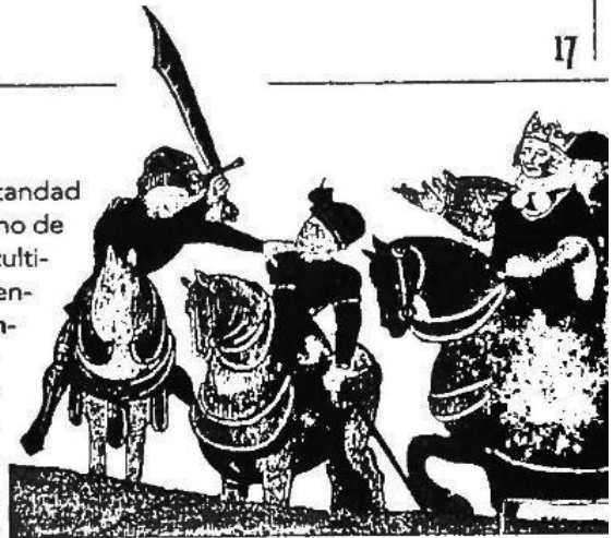
Esta ilustración representa la ejecución de Wat Tyler, quien lideró la rebelión de los campesinos ingleses contra los aumentos de

Europa llegó al final de la Edad Media envuelta en un panorama de cuestionamientos y cambios en la vida política, espiritual, intelectual y económica. Los reyes organizaban Estados centralizados alrededor de su poder. Muchas voces se levantaban contra el poder terrenal y la corrupción de la Iglesia. En las universidades se buscaban nuevas formas del conocimiento basadas en la experimentación y la investigación. Los grandes comerciantes movilizaban capitales para abrir nuevos mercados y los marinos se lanzaban hacia mares desconocidos. Una nueva época estaba a punto de comenzar.