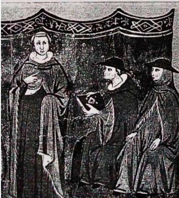
Ilustración de una crónica del siglo XIV que conmemora la elección del Papa Juan XXII en la ciudad francesa de Aviñón.

de John Wycliff en Inglaterra y el de Juan Huss en Bohemia (en la actual República Checa) criticaron la participación del Papado en las luchas políticas, denunciaron la corrupción eclesiástica y propusieron que los creyentes buscaran en la lectura directa de la Biblia las claves para la salvación del alma. Ante estas críticas, la Iglesia reaccionó con dureza: desautorizó las doctrinas de Wycliff y, en 1415, condenó a Huss a morir en la hoguera.