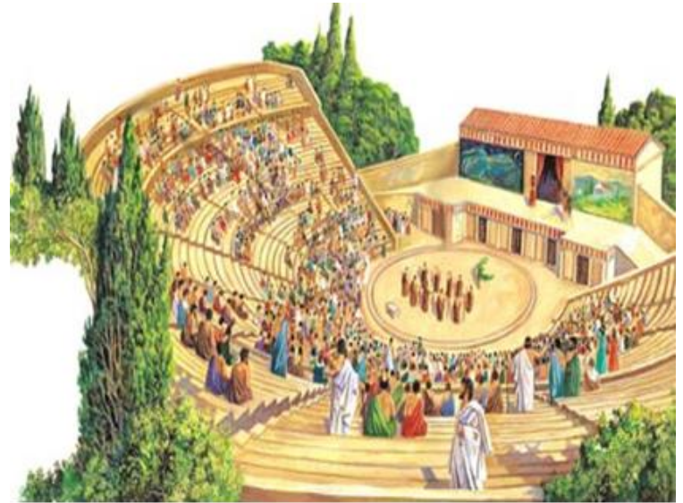
Los teatros griegos

Estas representaciones se fueron haciendo más complejas, hasta alcanzar la estructura de las dos formas básicas del teatro griego: la tragedia y de la comedia, que continúan siendo los mayores subgéneros dramáticos en Occidente.