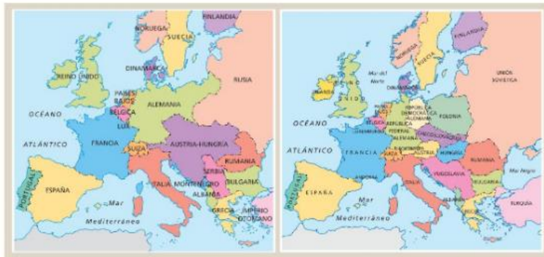
Doc. 3 Europa antes y después de la Primera Guerra Mundial.

En el período de paz posterior a la Primera Guerra Mundial, Alemania adoptó de nuevo una política expansionista y fue anexando paulatinamente tierras de países vecinos como Francia, Checoslovaquia y