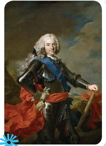
Retrato de Felipe V, primer rey de la dinastía Borbón en España.