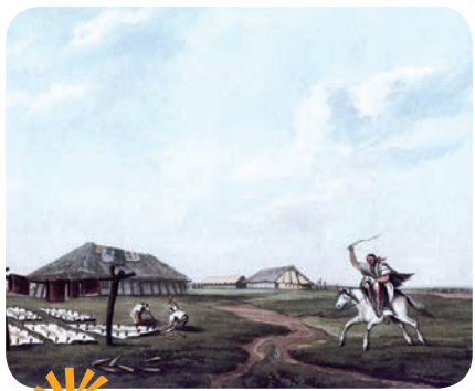
Estancia de San Pedro , pintura de Emeric Essex Vidal.

El Escudo de la Ciudad muestra a dos navíos y un ancla, en aguas del Río de la Plata, que destacan su condición de ciudad puerto, e invoca la protección del Espíritu Santo, representado en la paloma.