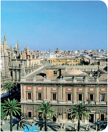
La Casa de Contratación tenía su sede en España, en la ciudad de Sevilla.

Buenos Aires era una de las ciudades que se encontraban más alejadas de los centros comerciales. Sus habitantes debían transportar mercaderías desde y hacia el puerto de Lima a través de medios terrestres, como las carretas.