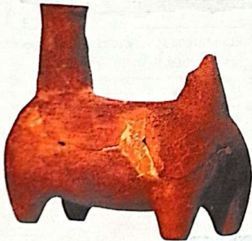
Vaso de cerámica huarpe.

• Nombren los principales cultivos de los huarpes.