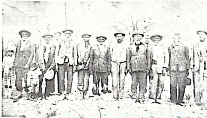
Descendientes de huarpes a fines del siglo XIX.

Además, piden la devolución de las momias huarpes que están en los museos para poder enterrarlas nuevamente en sus lugares originales.