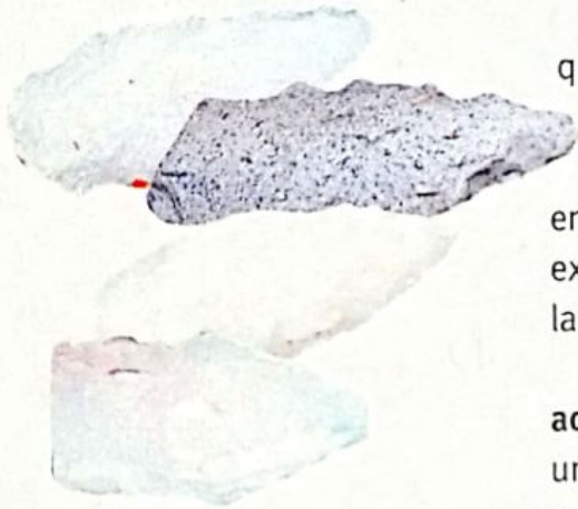
Puntas de flecha realizadas en piedra pertenecientes a la cultura La Fortuna.

Los morrillos se vestían con las pieles que obtenían de los animales que cazaban, unidas entre sí con fibras vegetales o nervios de animales, y se adornaban con collares de semillas y dientes o huesos.