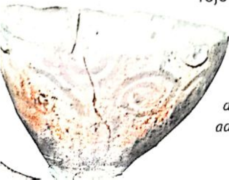
Cerámica perteneciente a la cultura Angualasto.

Los calingastas se destacaron por su arreglo personal. Los hombres y las mujeres llevaban el pelo largo hasta las rodillas, con flequillo y sujetado con vinchas. Las mujeres adornaban sus orejas con hilos de colores. Calzaban sandalias de cuero y vestían camisetas, ponchos y mantos tejidos en telar. Decoraban sus telas con dibujos de rombos y líneas, en color verde, rojo y tonos naturales.