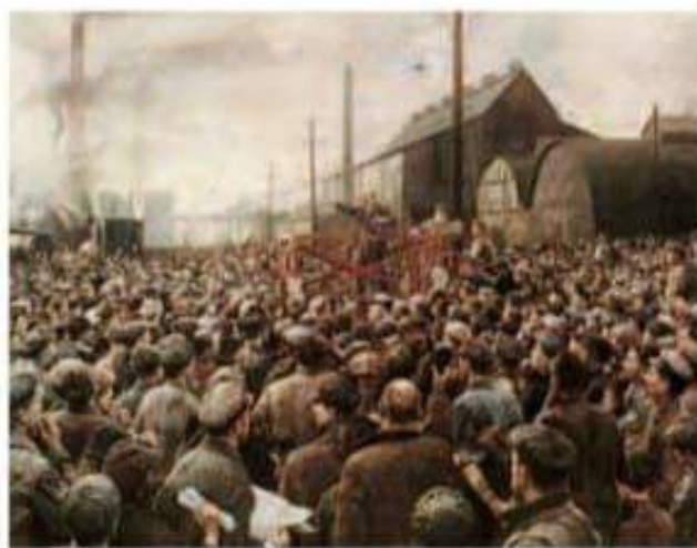
Lenin atengando a los trabajadores, óleo de Isaac Brodsky.

Paralelamente, la industria podría incrementar su capacidad de producción vendiendo herramientas, maquinarias y artículos de consumo a los campesinos (que comprarían con el dinero obtenido de la venta de sus cosechas). El objetivo, a mediano plazo, era disponer de excedentes que permitieran montar la industria pesada, capaz de generar energía, así como de fabricar productos metalúrgicos, materiales de construcción y maquinarias. En la práctica, en la industria se flexibilizaron las relaciones laborales mediante la diversificación de salarios e incentivos a la producción, a la vez que se permitió la propiedad privada de pequeñas y medianas empresas.