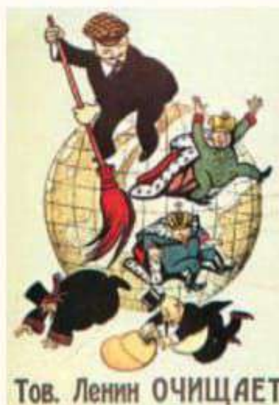
La traducción de la frase es: "El camarada Lenin limpia el mundo de basura".

Redacta un breve texto donde se explique la imagen y el efecto que esta busca lograr en el espectador.