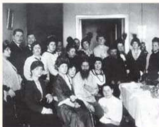
Rasputin rodeado de admiradoras.

Gregori Yefimovich Rasputín fue un monje ruso de gran influencia en los últimos días de la dinastía Romanov.