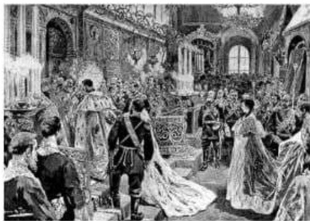
Doc. 1 Coronación de Nicolás II donde puede observarse el lujo del que se rodeaban los nobles rusos.

En cuanto a la clase media , al contrario de cómo se estaba afirmando en el resto del mundo, en el imperio era prácticamente inexistente y, en su mayoría, sus miembros eran reclutados por la burocracia zarista. En las ciudades, este sector estaba integrado por profesionales liberales o comerciantes, en tanto que en ámbitos rurales estaba conformado por un pequeño grupo de campesinos propietarios de tierras.