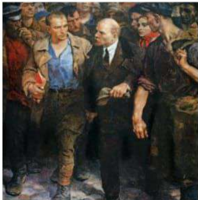
Doc. 2 Valentin Serov. Lenin con los revolucionarios durante el levantamiento de 1905.

Ante la derrota y la falta de alimentos, en enero de 1905, los trabajadores de San Petersburgo convocaron a una marcha, organizada por un sacerdote (pope) vinculado con la corte (el pope Gapón), para llamar la atención del zar sobre sus reclamos. A pesar de que era una manifestación pacífica, fue duramente reprimida. Ese día, en el que las tropas dispararon sobre los manifestantes que se hallaban frente al Palacio de Invierno, pasaría a la historia como el " Domingo Sangriento ".