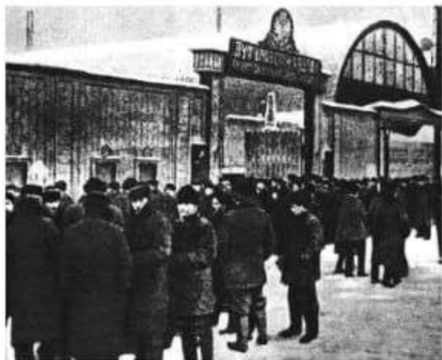
Huelga en la fábrica de armas Putilov, durante la Revolución de Febrero. Como en Rusia aún no se había adoptado la reforma del calendario que en el siglo XVI había decretado el papa Gregorio XIII, la Revolución de Febrero tuvo lugar, según nuestro calendario, en marzo.

El Comité de la Duma designó un gobierno provisional presidido por un noble liberal, el príncipe Georgi Lvov. Pero este gobierno no contó con el total apoyo