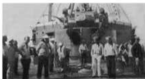
En 1925, Sergei Eisenstein llevó al cine el levantamiento del acorazado en el film El Acorazado Potemkin .

Durante este proceso, los organizadores de la oposición al gobierno fueron los liberales, que incluso pidieron que se convocara una Asamblea Constituyente. La participación de los partidos revolucionarios fue menor debido a que sus principales dirigentes se encontraban en el exilio.