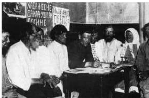
Soviet de Petrogrado.

El plan de Lenin, entonces, fue llevar a cabo una operación rápida para liquidar al débil gobierno provisional. Para lograr su objetivo contaba con una pequeña fuerza, decidida, bien armada y disciplinada.