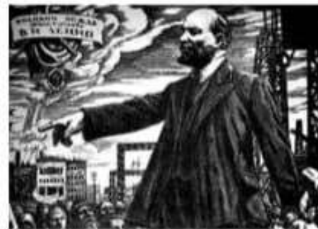
Afiche ruso donde puede verse a Lenin y a obreros revolucionarios.

Los bolcheviques percibieron el conflicto civil como una guerra de clases , tanto en términos locales como internacionales: proletariado ruso contra burguesía rusa; revolución internacional versus capitalismo internacional. Por eso, la victoria roja de 1920 fue considerada el triunfo del proletariado.