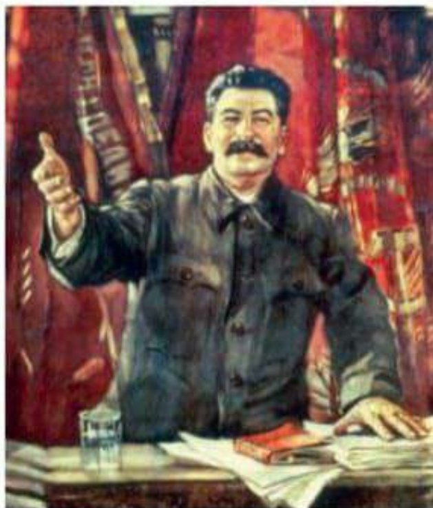
Josef Stalin (1879-1953).

Como opositor a la NEP, Stalin planteó un proyecto acelerado de industrialización, sostenido en la colectivización de la producción agrícola que elimi-