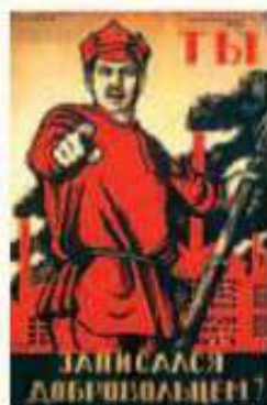
La frase en ruso dice: "¿Te alistaste como voluntario?"