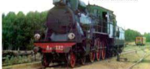
Locomotora perteneciente al Transiberiano, en 1910.

El desarrollo industrial se focalizó en San Petersburgo, la capital imperial –rebautizada Petrogrado en 1914, al comienzo de la Primera Guerra Mundial, y Leningrado, en 1924, en Moscú, en Kiev, en Jarkov y en Odessa. La instalación de las nuevas industrias y el aumento del número de trabajadores, que pasó de 600.000 en 1860 a 1.700.000 en 1900, produjeron un gran desarrollo urbano. Sin embargo, al estallar la Gran Guerra o Primera Guerra Mundial (1914-1918), el peso del agro seguía siendo aplastante en comparación con el todavía pequeño sector industrial.