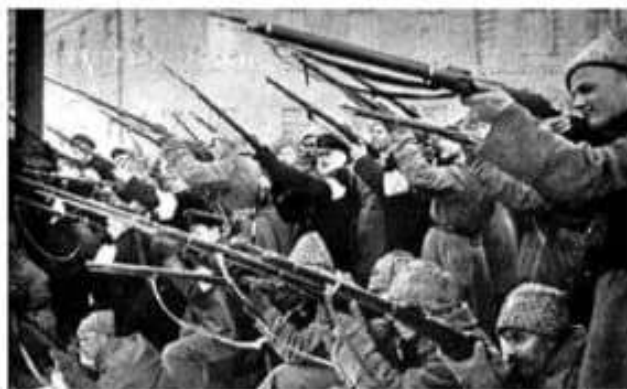
Tropas revolucionarias atacando a la policía zarista, durante la Revolución de Febrero de 1917.

Durante los cinco días más decisivos de protestas y movilizaciones se registraron, solo en la ciudad de San Petersburgo, alrededor de un millón y medio de muertos.