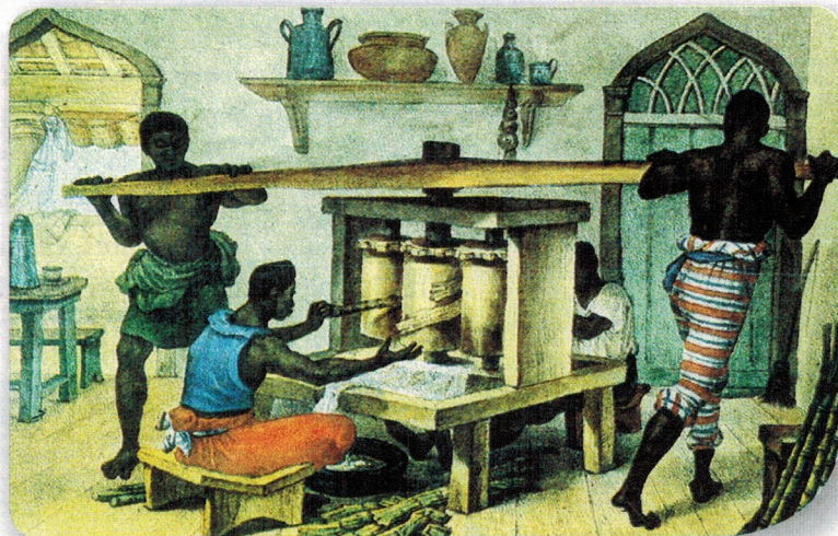
▲ La Asamblea del año XIII estableció que todos los hijos de esclavos, nacidos a partir de entonces, fueran libres.