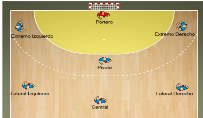
Imagen 1: cuadro ilustrativo de puesto de los atacantes