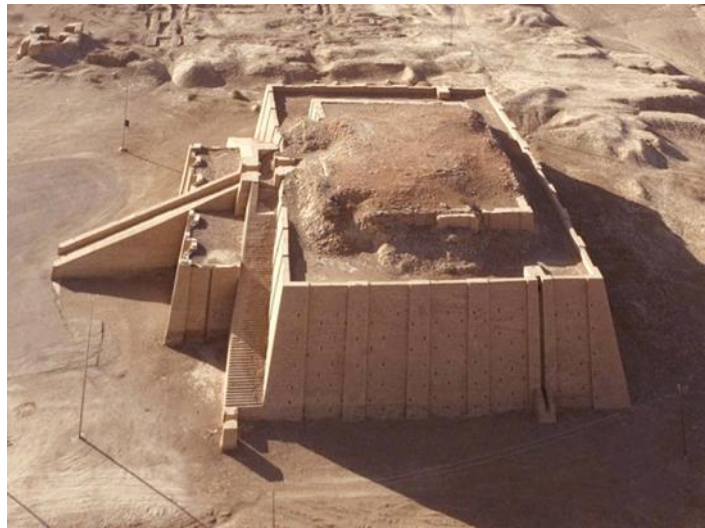
Zigurat o santuario de la antigua Mesopotamia.

La Mesopotamia es una región del Cercano Oriente (mirar mapa de la página 48 del manual de Santillana), cuyo nombre proviene del griego y significa “el país que está entre ríos”. Se llama así porque está encerrada entre los ríos Tigris y Éufrates, dos ríos de deshielo que se originan en las montañas del sudeste de Turquía. Pese a sus crecidas violentas y poco predecibles, ambos ríos fueron de gran importancia para los cultivos de los pueblos que se asentaron en sus márgenes.