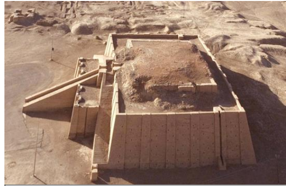
Zigurat o santuario de la antigua Mesopotamia.

A lo largo de los años, diversos pueblos habitaron este lugar. Uno de estos pueblos fueron los sumeros o sumerios. La agricultura y la ganadería eran dos de las principales ramas económicas sumerias, así como la pesca y la crianza de animales de carga. Esta