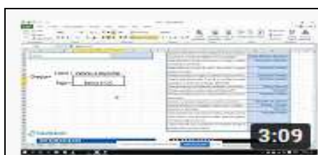
Asiento de Compra| Libro diario https://youtu.be/hsdJyVcU4HE