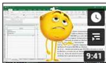
Libro diario Asientos simples https://youtu.be/kRYtOdHANnc