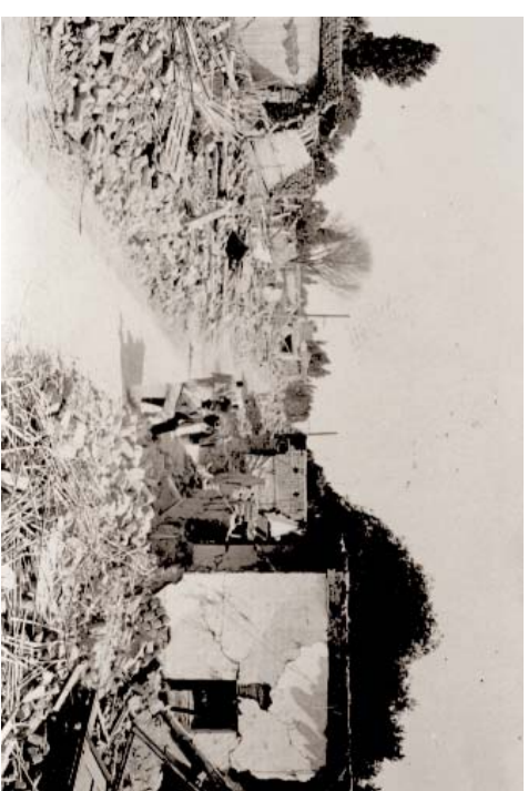
San Juan, enero 1944, calle, Archivo General de la Nación, Buenos Aires, Argentina.

Muchos vieron al terremoto como un juicio radical a un orden político fundado en la exclusión y la violencia. Los rumores populares en la ciudad devastada contaban de médicos en fuga y oligarcas sin piedad. Las voces autorizadas del gobierno militar y la prensa nacional enfatizaron la falta de previsión, de solidaridad y de responsabilidad de parte de elites corruptas. “La destrucción fue enormemente desproporcionada con respecto a la intensidad del sismo”, ratificó un profesor de geología, lo cual “se debió, ante todo, a la pésima calidad de construcción” y a la falta absoluta de previsión. 17 Apenas dos años antes, los autores del plan regulador para la ciudad habían juzgado al “problema sísmico” como “no crucial para San Juan en este momento”. 18 Al mirar las ruinas del edificio municipal, terminado en 1941, un periodista local observó que las muertes no se deben tanto al terremoto sino “a la mala y