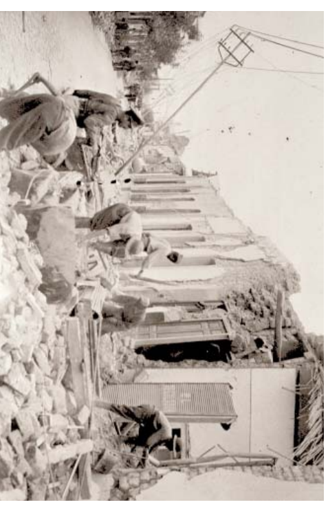
Recuperación, Archivo General de la Nación, Buenos Aires, Argentina.

plir con sus funciones más esenciales, mucho menos expandirlas con la ambición propia del momento político.