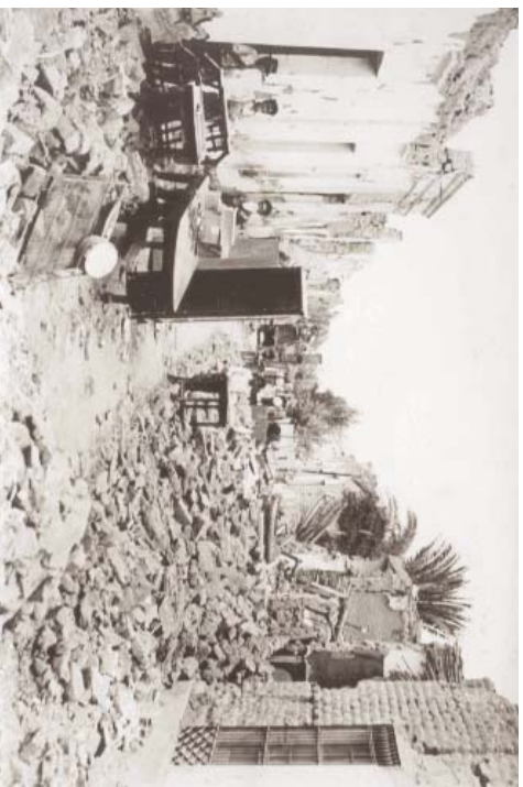
San Juan, enero 1944, Archivo General de la Nación, Buenos Aires, Argentina.

pésima construcción de los que se han dado en llamar edificios, cuando el calificativo más exacto que debería aplicarse es el de sepulcros blanqueados . 19 Para este periodista, la falta de garantías y el uso de materiales inadecuados en este edificio eran emblemáticos de la debilidad de las instituciones locales. Y esa misma debilidad se había puesto en evidencia con la ausencia de las elites en el momento de la crisis.