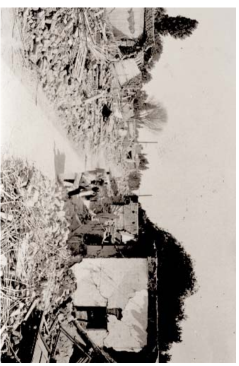
San Juan, enero 1944, calle.

Muchos vieron al terremoto como un juicio radical a un orden político fundado en la exclusión y la violencia. Los rumores populares en la ciudad devastada contaban de médicos en fuga y oligarcas sin piedad. Las voces autorizadas del gobierno militar y la prensa nacional enfatizaron la falta de previsión, de solidaridad y de responsabilidad de parte de elites corruptas. “La destrucción fue enormemente desproporcionada con respecto a la intensidad del sismo”, ratificó un profesor de geología, lo cual “se debió, ante todo, a la pésima calidad de construcción” y a la falta absoluta de previsión. 17 Apenas dos años antes, los autores del plan regulador para la ciudad habían juzgado al “problema sísmico” como “no crucial para San Juan en este momento”. 18 Al mirar las ruinas del edificio municipal, terminado en 1941, un periodista local observó que las muertes no se deben tanto al terremoto sino “a la mala y