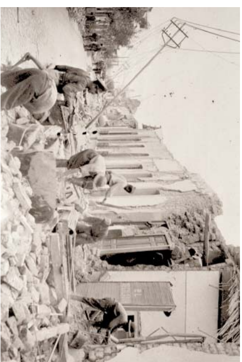
Recuperación, Archivo General de la Nación, Buenos Aires, Argentina.

plir con sus funciones más esenciales, mucho menos expandirlas con la ambición propia del momento político.