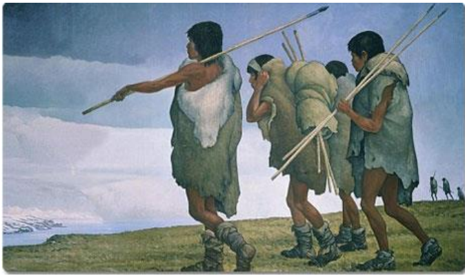
Representación de los primeros pobladores americanos

El poblamiento se realizó de norte a sur: partamos del norte, en Alaska los hallazgos humanos datan de hace 30 mil años, en Canadá 30 mil años, California 27 mil años, México 20 mil años, Venezuela 14 mil años, Perú 18 mil años, Chile 11 mil años y en la Patagonia 9 mil años.