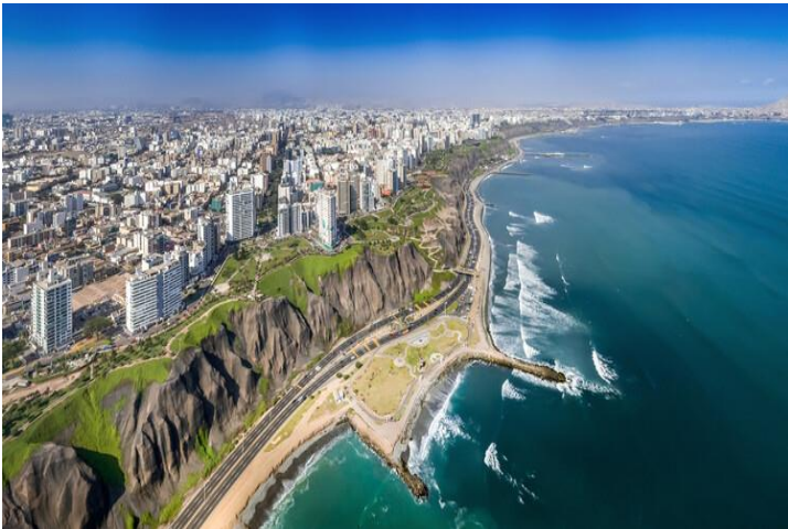
Vista aérea de la ciudad de Miraflores, el acantilado y la

carretera de la Costa Verde. Lima, Perú.