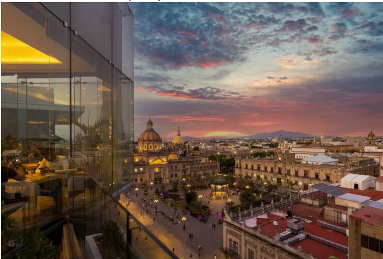
Guadalajara, Jalisco, México, octubre de 2021:

Restaurante de un hotel de moda con vistas panorámicas a la plaza principal de Guadalajara y a la Catedral de Guadalajara y al horizonte de la ciudad.