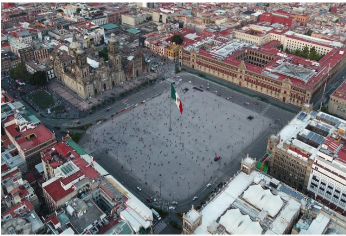
Remodelación de la Plaza de la Constitución (El Zócalo) en la Ciudad de México por LUCIO MUNIAIN et al y FUNDAMENTAL.