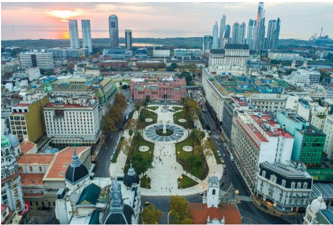
Foto aérea con drones. Plaza de Mayo (Plaza de Mayo) en Buenos Aires, Argentina. Es el eje de la vida política de Argentina.