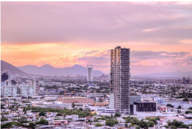
Vista de Monterrey.