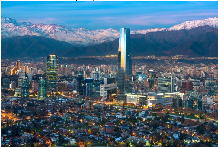
Vista panorámica de los distritos de Providencia y Las Condes con rascacielos Costanera Center, Torre de Titanio y Cordillera de Los Andes, Santiago de Chile. Image