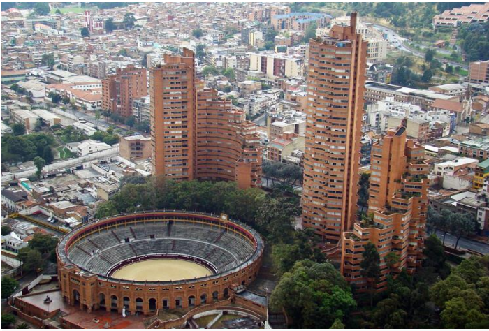
Torres del Parque / Rogelio Salmona.