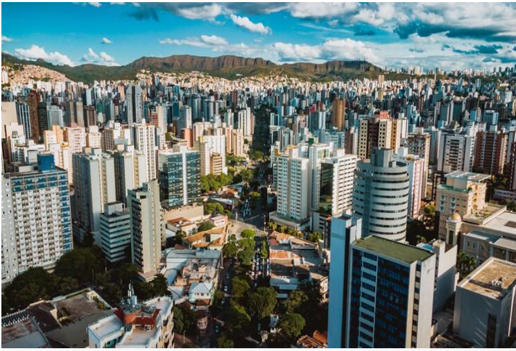
Belo Horizonte, Minas Gerais, Brasil - 15 de marzo de

2022: Vista del centro de la ciudad.