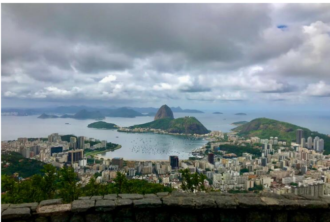
Estado de Río de Janeiro (Brasil).