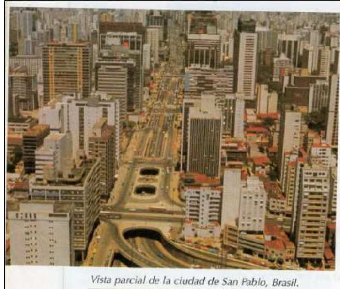
Vista parcial de la ciudad de San Pablo, Brasil.