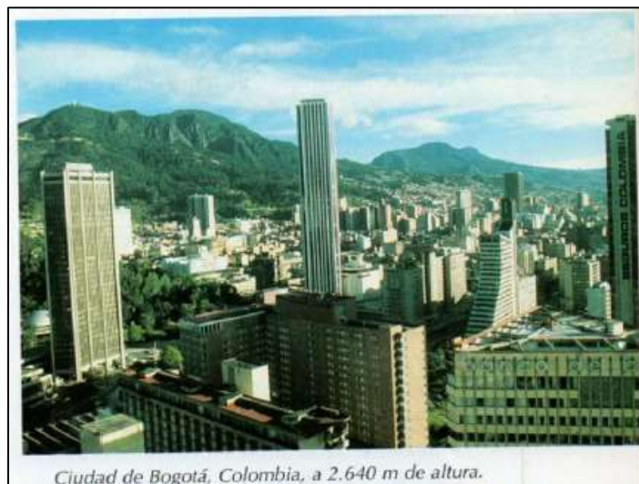
Ciudad de Bogotá, Colombia, a 2.640 m de altura.