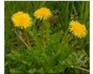
DIENTE DE LEÓN