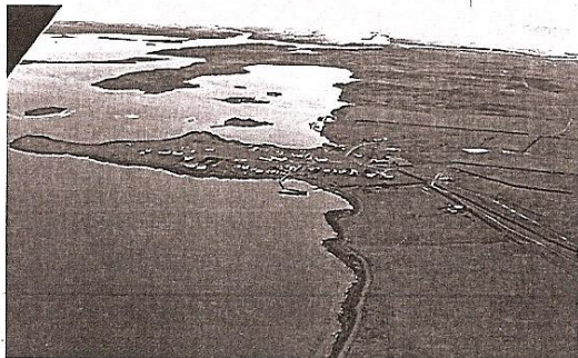
Vistas de las islas Malvinas.