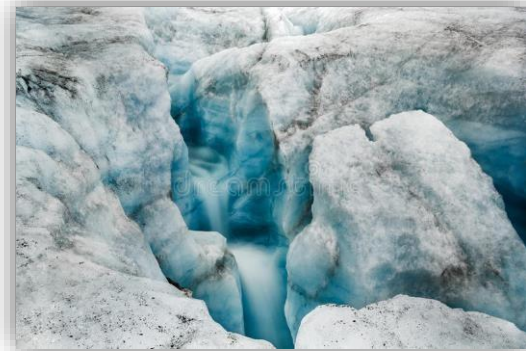
“Glaciar Serp- i- Molot, Nueva Zembla, Océano Glaciar Artico”.