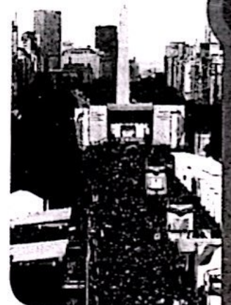
La mayoría de los medios locales publican crónicas sobre eventos relevantes para la sociedad, como el festejo del Bicentenario en el año 2010.