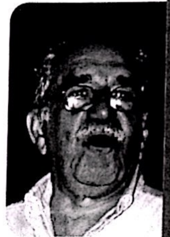
Gabriel García Márquez (1927-2014) tuvo una importante carrera como periodista, que influyó en su obra literaria.