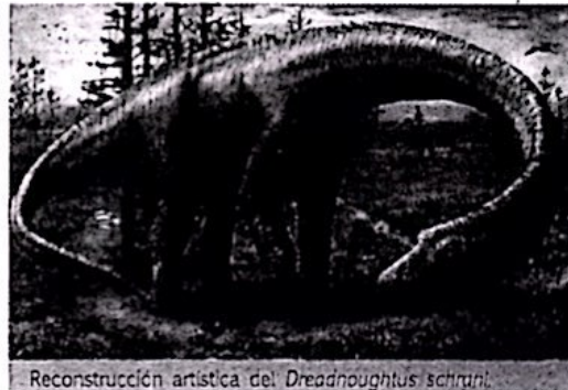
Reconstrucción artística del Dreadnoughtus schrani .