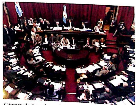
Cámara de Senadores de la Nación.