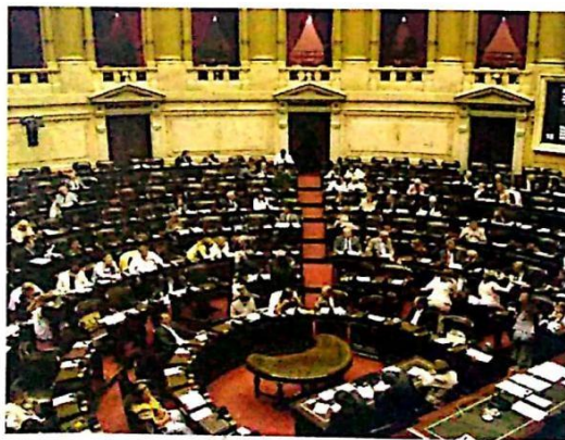
Cámara de Diputados de la Nación.