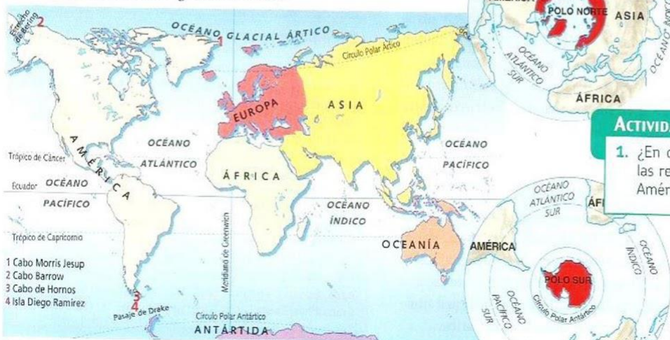
Doc. 3 Posición de América en la superficie terrestre.

Las tierras más septentrionales se encuentran desplazadas más allá del Círculo Polar Ártico y están bañadas por el océano Glacial Ártico, por eso podemos hablar de la zona ártica del continente americano. Además, una serie de islas están próximas al Polo Norte. Entre el cabo Morris Jesup, en el norte de Groenlandia (a 83° 39'), y el Polo Norte solo median 7 grados de latitud.