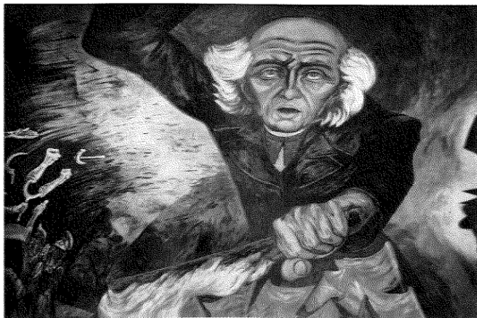
Doc. 10 Detalle de un mural realizado por José Clemente Orozco en el que se puede ver una imagen de Miguel Hidalgo.

José María Morelos , otro líder revolucionario, logró unificar a los grupos que habían sobrevivido a la represión y organizó un nuevo levantamiento. Morelos lideró un ejército mejor organizado que el de Hidalgo, por lo que se convirtió en una seria amenaza para las autoridades españolas. Además, diseñó un programa político más definido que el de su predecesor. En él se proponía no solo la independencia, sino también un sistema de gobierno parlamentario e importantes reformas sociales, que incluían el reparto de la tierra a los campesinos y la confiscación de aquellas propiedades que pertenecían a los enemigos.