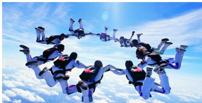
La gravedad atrae a todos los cuerpos hacia el centro de la tierra.

Estas características de los movimientos verticales se deben a una fuerza que atrae a todos los cuerpos hacia el centro de la Tierra, denominada fuerza de gravedad terrestre . Esta fuerza es la que determina el peso de los cuerpos.