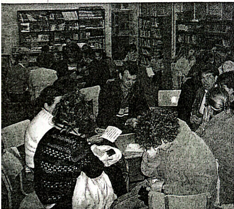
El trabajo grupal es una de las estrategias utilizadas en el campo de la Psicología institucional.

Entre los temas de la Psicología institucional como campo de investigación y práctica, hay algunos que le son propios: procesos de identificaciones, sufrimiento institucional; otros relacionados con la Antropología: cultura, mitos, ritos; la Historia: Historia oral y vida cotidiana, historia de vida; la Ecología: intercambios con el medio ambiente; Economía: asignación y distribución de recursos; Sociología agrupamientos humanos y otros múltiples entrecruzamientos.