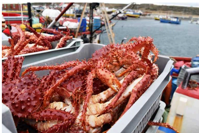
Pesca de centollas

Dependían de la cría de ovejas. El ingresos del turismo, de la pesca comercial, de la industria de la pesca y de la agricultura. La moneda de las islas es la libra malvinense, que está respaldada por la libra esterlina y la exploraciones mineras y petroleras en las islas (aunque el asunto del petróleo en 2010 y la minería es poco conocida)