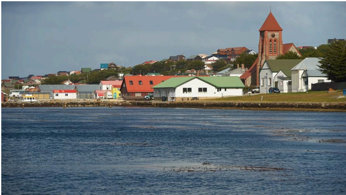
Puerto Argentino o Stanley, capital de las islas

Su ciudad más importante es el principal centro urbano es Puerto Argentino o “Stanley”, que se encuentra en la parte oriental de la isla Soledad. Su población es de 2.100 habitantes aproximadamente y con ascendencia británica.