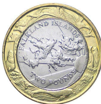
Libra esterlina (2 libras) 2004