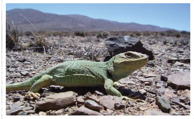
Pristudactylus scapulatus , en la Reserva de la Biósfera de San Guillermo.

En San Juan continuamente se descubren nuevas especies; hace algunos años se descubrió en la reserva de San Guillermo la presencia del Gato Andino ( Oreailurus jacobita ) cuya distribución hasta la fecha no correspondía a estas latitudes. En la misma reserva se han descubierto 4 especies nuevas de reptiles (dos de las cuales aún se encuentran en descripción) además se citan 12 especies de lagartos de distribución nueva para el Parque Nacional Ischigualasto y 3 citas nuevas de mamíferos en un análisis de la avifauna de los humedales de los valles de Zonda y Ullum, encontraron 7 especies de nueva mención para estas áreas. En nuestra provincia se encuentran 325 especies de aves divididas en 21 órdenes y 52 familias dentro de las cuales existe una gran cantidad de géneros representados.