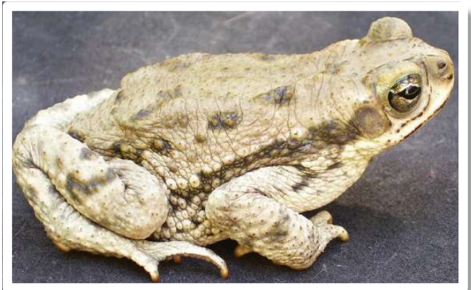
Rhinella bernardoi sp. nova, especie endémica del Parque Provincial Ischigualasto.

Dentro de los anfibios, Rhinella bernardoi sp. Nova corresponde a una especie nueva para la ciencia y sería endémica del parque Provincial Ischigualasto. La desaparición de una especie endémica de una región significaría una pérdida definitiva de ese patrimonio genético tanto para la Argentina como para la humanidad. La atención particular que deben merecer las especies endémicas de un país se basa en el concepto de responsabilidad última (WCMC, 1994) que le cabe a nivel global a ese país respecto a su conservación. Se ha consensuado a nivel internacional que si bien la conservación