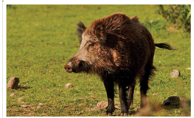
Jabalí ( Sus scrofa )

Se destacan que la introducción de nuevas especies en hábitats extraños ya sea por accidente o deliberadamente ha tenido consecuencias devastadoras, por lo que estas introducciones son desaconsejadas por