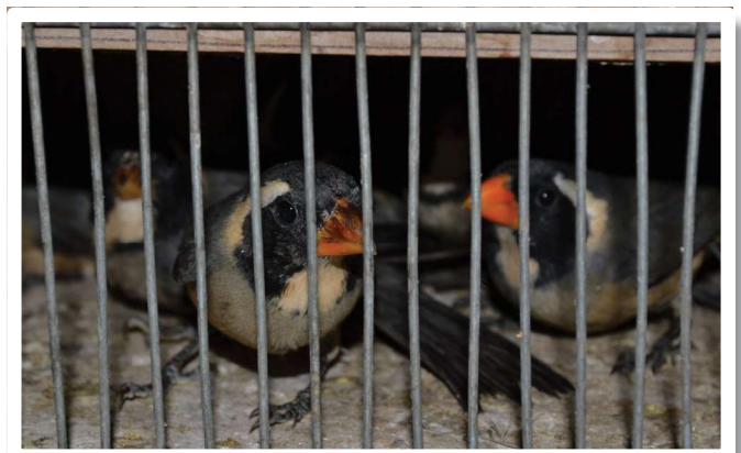
Benteveos capturados ilegalmente

En 1973, para poner freno a este comercio ilegal,