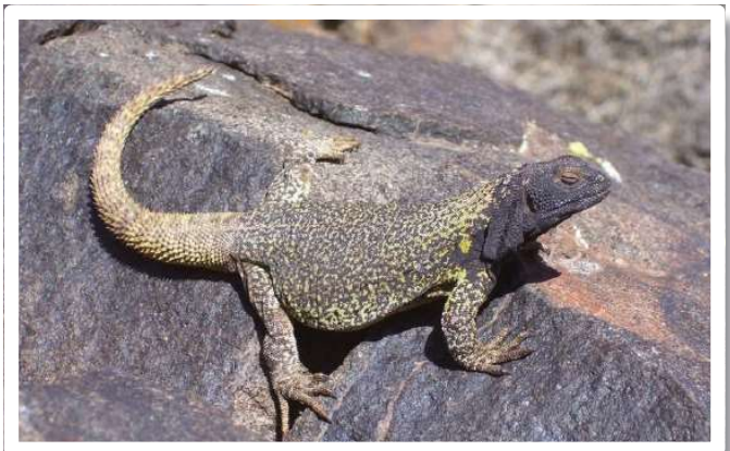
Phymaturus punae, especie endémica de la Reserva de la Biósfera de San Guillermo.

De las 195 especies de saurios que se registran para la Argentina, el 18% se encuentra en nuestra provincia, de las cuales el 14% son especies endémicas. Desde 1983 se destaca la importancia de realizar estudios en la Reserva de la Biósfera San Guillermo, por su elevado contenido de especies endémicas, es así que hasta la fecha se han detectado en el área de la reserva 7 especies de saurios nuevas, por lo que se hace imprescindible incrementar los estudios ecológicos y biológicos de las mismas para llevar a cabo planes de manejo para su conservación.