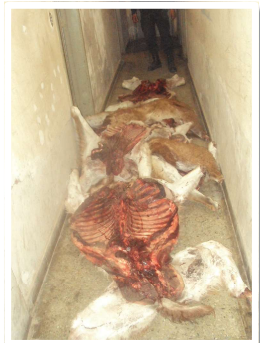
Guanacos víctimas de la caza furtiva

Por lo general, se cree que el único responsable del comercio ilegal de fauna es el “traficante”. Pero hay cazadores, recolectores, acopiadores, transportistas, comerciantes minoristas, distribuidores o mayoristas, empresarios, funcionarios gubernamentales, exportadores, importadores y el público consumidor, que por falta de conciencia, de información o de una conducta más solidaria o ética participan de estos ilícitos.