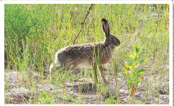
Liebre europea (Lepus europaeus)

Entre las aves la especie introducida más emblemática es el gorrión ( Passer domesticus ), ocupando casi todas las eco-regiones de la provincia.