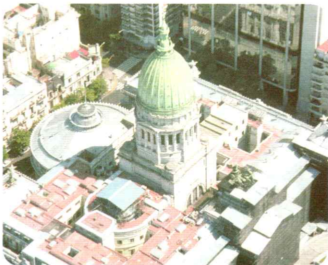
Vista aérea del Congreso de la Nación, sede del Poder Legislativo.

Para que la ley entre en vigencia deben darse dos pasos más fuera del Congreso: el presidente debe promulgarla y publicarla en el Boletín Oficial. Recordá que en los gobiernos presidencialistas como el nuestro, el presidente tiene la facultad de vetar la ley. En ese caso, vuelve al Congreso, donde cada Cámara puede insistir con la aprobación si logra reunir el voto de los dos tercios de sus legisladores. Si esto sucede, la ley queda promulgada automáticamente.