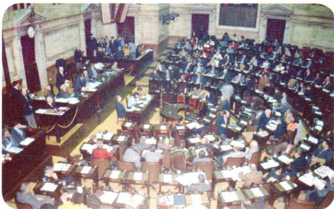
Sesión en la Cámara de Diputados, en el Congreso de la Nación.

La Cámara de Senadores o Senado es el órgano de representación federal, es decir, donde se expresan los intereses de las provincias y de la Ciudad de Buenos Aires. El número de senadores es fijo : 3 por cada unidad autónoma; en total, 72. ¿Cómo se los elige? Los partidos y alianzas políticas presentan en cada provincia y en la Capital dos candidatos. La fuerza política que más votos obtiene, envía dos senadores al Congreso Nacional; la segunda fuerza, uno. Los senadores permanecen 6 años en el cargo y también pueden ser reelegidos. Cada dos años, 8