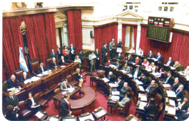
Sesión en la Cámara de Senadores, en el Congreso de la Nación.

provincias o la Ciudad de Buenos Aires renuevan sus senadores.