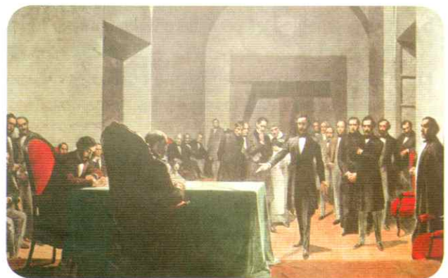
Los representantes de las provincias en la Asamblea Constituyente reunida en Santa Fe, en 1853.

introdutorio, denominado Preámbulo , que da cuenta del contexto, de los fundamentos y los objetivos de la Ley Suprema. Este texto fue redactado sobre la base del preámbulo de la Constitución de los Estados Unidos. ¿Por qué? Porque la constitución de ese país fue el modelo en el que se inspiraron los integrantes de la elite que ejercían una fuerte influencia en las ideas políticas de la época. En 1852, Juan Bautista Alberdi había publicado su libro Bases y puntos de partida para la organización política de la República Argentina , en el que analizaba las constituciones de América, la historia y las necesidades de la Argentina y proponía el proyecto de constitución que fue tomado por los constituyentes en 1853.