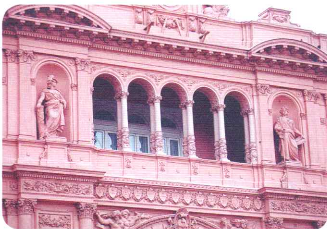
Balcón de la Casa Rosada, sede del Poder Ejecutivo Nacional.