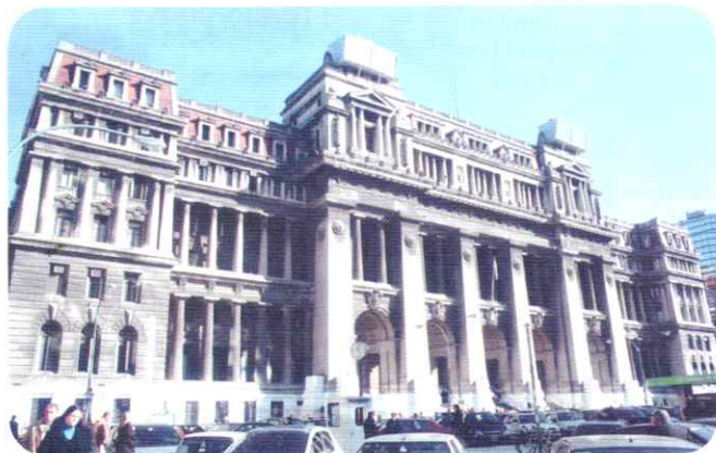
Palacio de Justicia de la Nación, sede de la Corte Suprema de Justicia y los tribunales inferiores.

Si bien, como acabamos de explicar, el Poder Judicial tiene que ser independiente, también debe contribuir al equilibrio de poderes y al control del poder político. Por eso, inspirándose en el modelo estadounidense, la Constitución le asignó algunas funciones que lo vinculan al Poder Ejecutivo y al Legislativo. La principal de esas funciones es el control de constitucionalidad de las leyes sancionadas por el Congreso Nacional y de los decretos dictados por el presidente. Si alguna persona u organismo se viera afectado por la aplicación de una norma que contradice la Constitución Nacional o la de alguna provincia, puede presentar una demanda ante un juez y este, si le da la razón, declarar que la norma es inconstitucional y debe dejar de aplicarse.