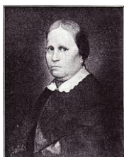
Un amor en la plaza

La intertextualidad es la relación que un texto (oral o escrito) mantiene con otros textos (orales o escritos), ya sean contemporáneos o históricos. Este tipo de relación amplía las posibilidades interpretativas de cualquier texto.