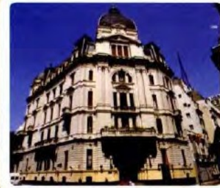
Jefatura de gobierno de la Ciudad Autónoma de Buenos Aires, sede del Poder Ejecutivo local.