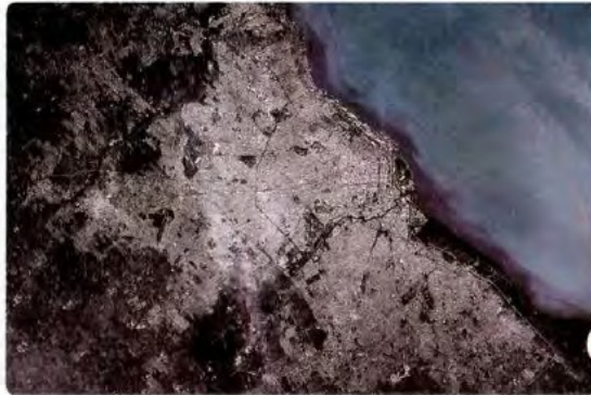
Ciudad Autónoma de Buenos Aires.

En 1996 se sancionó la Constitución de la Ciudad de Buenos Aires y se eligió al primer Jefe de Gobierno de la Ciudad (ganó la elección Fernando De la Rúa), que representó el Poder Ejecutivo local. También existe un Poder Legislativo unicameral, elegido por el voto popular: la Legislatura de la Ciudad , compuesta por sesenta legisladores (+INFO).