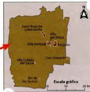
Municipios del departamento de Calamuchita.

En la provincia de Córdoba, los municipios se identifican solo con los centros urbanos, como puede verse en el ejemplo del departamento de Calamuchita.