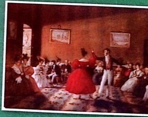
Minuet, pintura de Carlos Pellegrini Buenos Aires, 1833

En las casas de las familias ricas se organizaban tertulias los sábados al atardecer. En esa ocasión, se abría la sala principal para recibir a los invitados: familiares, amigos, socios y visitantes ocasionales. Los invitados charlaban, comían churros y pastelitos, y tomaban mate cocido o chocolate caliente. Como no existían reproductores de música grabada, las jovencitas solían tocar el piano, la guitarra o el arpa. El repertorio incluía minués y cielitos para que los invitados bailaran.