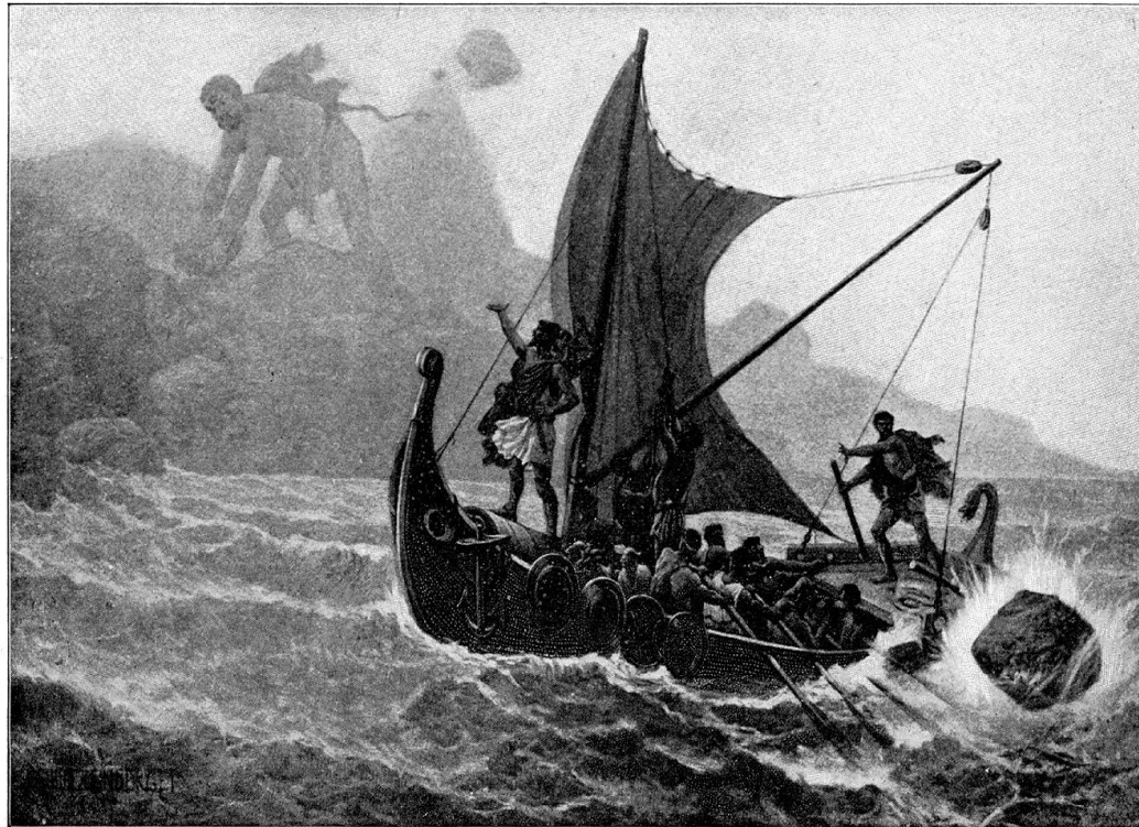
THE CYCLOPS IN HIS WRATH BRAKE OFF THE TOP OF A GREAT HILL