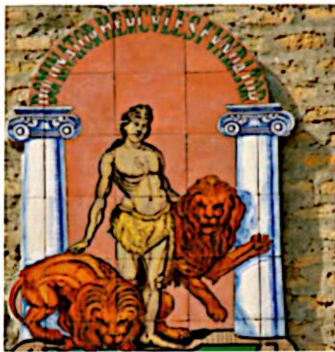
Hércules, héroe griego.

En la tragedia, tanto los dioses como el destino dirigen las acciones de los hombres: