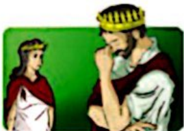
Edipo y Yocasta.

Se considera que es la obra maestra de Sófocles; en ella muestra el sistema monárquico de Grecia, gobernada por Pericles, gran amigo de él. Es una tragedia desarrollada en una unidad de tiempo y está estructurada en un solo acto con un prólogo y ocho episodios. Sus personajes son destacados y de condición social elevada. La obra finaliza con el sacrificio de dos de los personajes principales: Edipo y Yocasta.