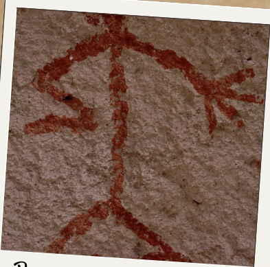
Pinturas en las paredes