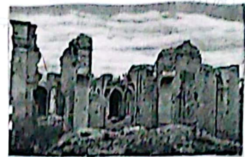
La catedral de La Rioja "San Nicolás de Bari" (que se encuentra en la Plaza 25 de Mayo) totalmente destruida tras el sismo

Como consecuencia directa hubo 52 muertos en San Juan; 9 en Mogna, 7 en Rodeo, 8 en Las Flores, 6 en Iglesia y 2 en Huaco. En la ciudad de San Juan murieron solamente 12 personas, en Albardón 4, en Angaco 1, en Jáchal 4, y en la ciudad de La Rioja 8