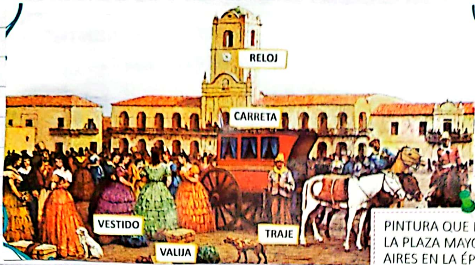
PINTURA QUE REPRESENTA LA PLAZA MAYOR DE BUENOS AIRES EN LA ÉPOCA COLONIAL.