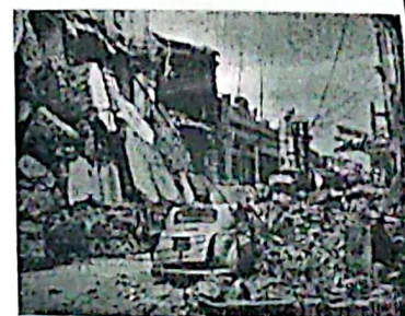
Las calles de la ciudad de San