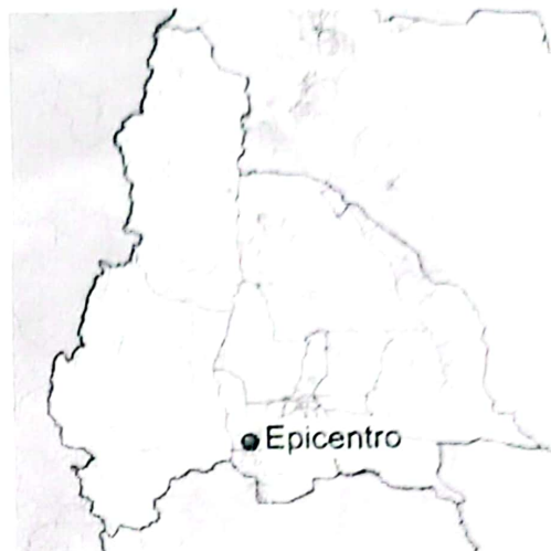
Epicentro (Provincia de San Juan)

6.4 en potencia de Magnitud de Momento ( M_W )