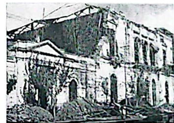
Vista de la Casa de Gobierno de la provincia de San Juan completamente destruida.