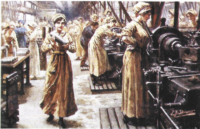
DOC. 7 Durante el conflicto, más de un millón de mujeres se incorporaron a la industria de guerra en el Reino Unido.