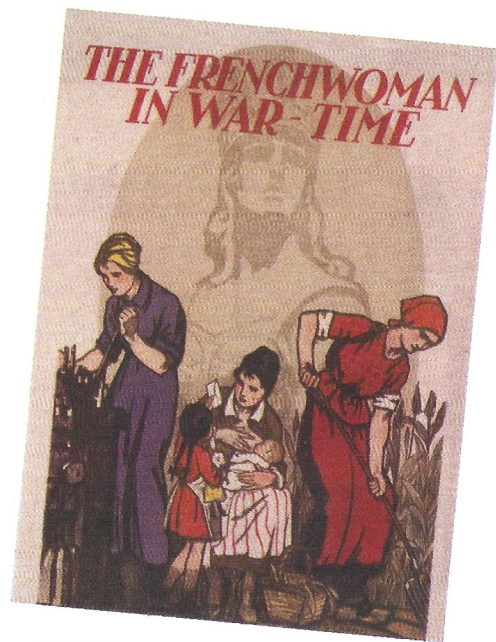
DOC. 6 Cartel de 1917 donde se puede leer: "La mujer francesa ante la guerra".