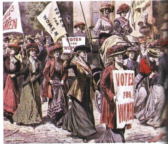
DOC. 1 Manifestación de sufragistas reclamando el derecho al voto de las mujeres.