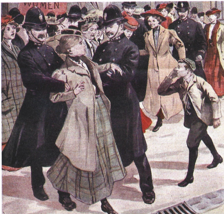
DOC. 3 Sufragistas inglesas detenidas por reclamar el derecho al voto, 1907.

En 1903, la campaña por el sufragio femenino se intensificó con la fundación de la Unión Social y Política de Mujeres , promovida por Pankhurst y sus hijas. Cansadas de tantas respuestas negativas, las sufragistas pasaron a la lucha directa y adoptaron la táctica de interrumpir los discursos de los ministros y presentarse en las reuniones del partido liberal para plantear sus demandas. Además de los tradicionales medios de propaganda como los mítines y las manifestaciones, también recurrieron al sabotaje, al incendio de comercios y de establecimientos públicos, y a las agresiones a los domicilios privados de destacados políticos y miembros del parlamento.