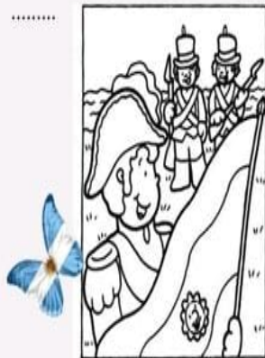
BELGRANO A SUS SOLDADOS ORGULLOSO LA MOSTRÓ, Y JURARON DEFENDERLA CON GRANDEZA Y CON VALOR.