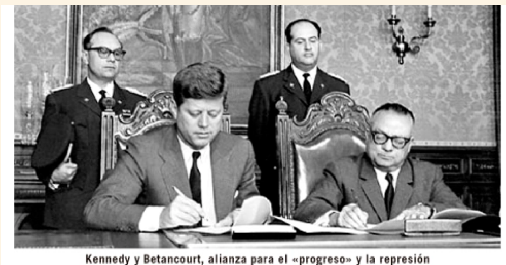
Kennedy y Betancourt, alianza para el «progreso» y la represión