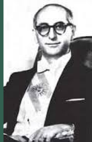
Doctor Don Arturo Frondizi Presidente Constitucional de la República Argentina (1958-1962).

Arturo Frondizi y Kubitschek promovieron la radicación de industrias extranjeras Impulsar el "Desarrollo de la Industria Nacional" (recomendado por la CEPAL)