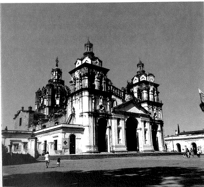
Doc. 11 Catedral de la ciudad de Córdoba. El Congreso Constituyente que Bustos intentó reunir en esa ciudad fracasó, entre varios factores, por la actitud de Buenos Aires.