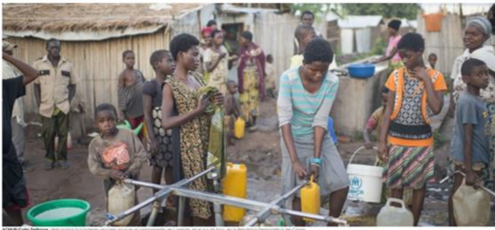
Migrantes burundeses recogen agua en el campamento de Luemba, en el sur del Kivu, en la República Democrática del Congo.