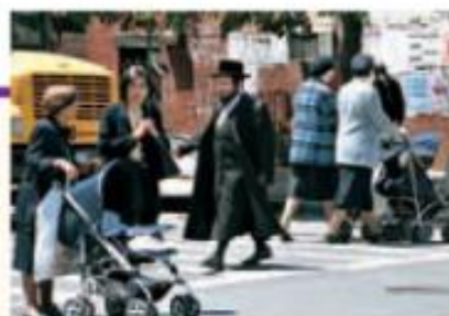
Barrio judío en Nueva York.

Luego de las revoluciones burguesas, el nacionalismo adquirió un rol central para la política: en el siglo xx comenzó a utilizarse como criterio para delimitar qué pueblos se integraban a un Estado y cuáles quedaban excluidos de él. Es el denominado "principio de las nacionalidades". Este principio orientó la política de cada Estado con respecto a los demás y llevó a discutir los límites territoriales.