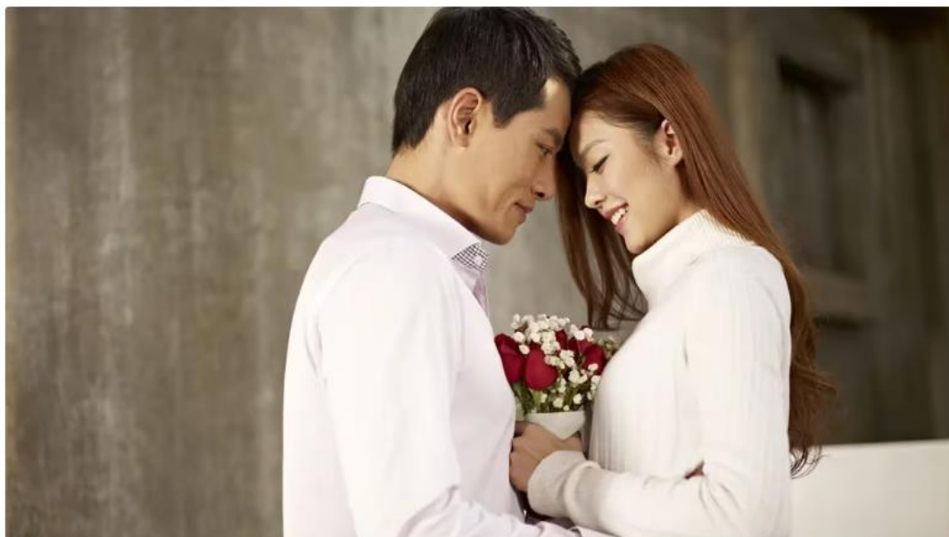
Japón implementa diversas iniciativas, incluyendo subsidios de vivienda y cuidado infantil, para enfrentar la baja tasa de natalidad

El declive de la tasa de natalidad ha acelerado en los últimos años, exacerbado por cifras de mortalidad que superan los nacimientos cada año. En 2023, Japón registró 1,57 millones de muertes, según el Ministerio de Salud, lo que supera en más del doble al número de nacimientos reportados.