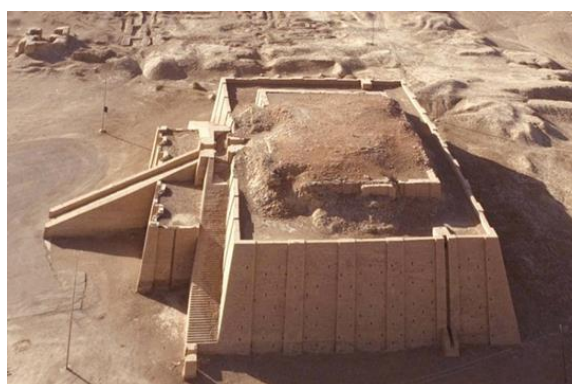
Zigurat o santuario de la antigua Mesopotamia.

A lo largo de los años, diversos pueblos habitaron este lugar. Uno de estos pueblos fueron los sumeros o sumerios. La agricultura y la ganadería eran dos de las principales ramas económicas sumerias, así como la pesca y la crianza de animales de carga. Esta