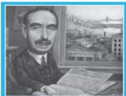
Caricatura de J. M. Keynes