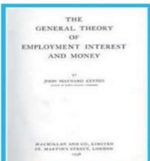
Primera edición de la obra de Keynes en 1936, por Macmillan.

Según su teoría, el ingreso total de la sociedad está definido por la suma del consumo y la inversión. En una situación de desempleo (cuando hay capacidad productiva no