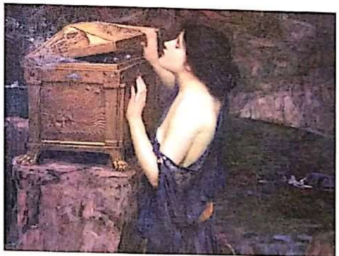
Pandora, John William Waterhouse, 1896

mano, que lo había exhortado a desconfiar de los dones del cielo, se dejó seducir por la fascinadora criatura, firmando así la condena de la humanidad.