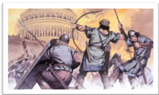
Caída de Constantinopla – 1453 d.C

En el año 1453 d.C se produce la Caida del Imperio Romano de Oriente , y como consecuencia la caída de Constantinopla (Capital del imperio) en poder de los turcos otomanos. Este hecho generó dos acontecimientos importantes: en primer lugar, con este suceso inicia la EDAD MODERNA (1453 -1789) y en segundo lugar, Europa se vio imposibilitada para poder comerciar especias y alimentos con los países de Asia (China e India). Lo que llevó a que los Europeos buscaran nuevas rutas para poder llegar a estos lugares tan lejanos. Los portugueses,