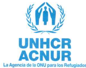
Alto Comisionado de las Naciones Unidas para los Refugiados (Acnur).