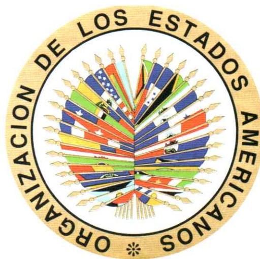
Emblema de la OEA, donde funciona la Corte Interamericana de Derechos Humanos.

o diferencia política. No obstante, se pusieron en evidencia otros problemas sociales igualmente graves que revelan que los derechos humanos no están garantizados para todos. La falta de trabajo, la precarización de la vivienda, el hambre, la explotación laboral, la contaminación del ambiente y la discriminación a grupos por su origen étnico, nacional, religioso o por su identidad de género, entre otros casos, siguen siendo problemas que afectan al conjunto de la sociedad. Trabajar por una democracia plena significa respetar y hacer respetar el conjunto de los derechos humanos.