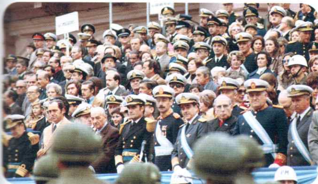
Junta Militar que encabezó el golpe de Estado de 1976.

En la Argentina, esta etapa fue llevada adelante por los militares que dieron un golpe de Estado el 24 de marzo de 1976 y establecieron una dictadura que se autodenominó Proceso de Reorganización Nacional . La Junta Militar que derrocó al gobierno constitucional de María Estela Martínez de Perón estaba integrada por los tres comandantes en jefe de las Fuerzas Armadas y dio inicio a una política de terror nunca antes vivida en el país.