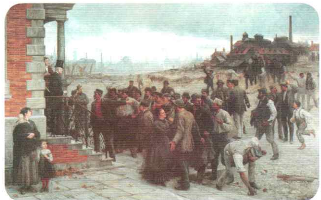
La huelga, obra del pintor alemán Robert Koehler, 1881.

Recién a mediados del siglo xx se acuñó la expresión derechos humanos para referirse a un modo particular de concebir los derechos. En términos generales, se podría definir a los derechos humanos como aquellos que corresponden a los seres humanos por el solo hecho de serlo. Su objetivo es concretar un proyecto de vida digna para cada persona. La realización de los derechos humanos es posible a través de una convivencia entre personas, grupos, naciones y pueblos, basada en los principios de la libertad, la dignidad, la igualdad y la justicia social.