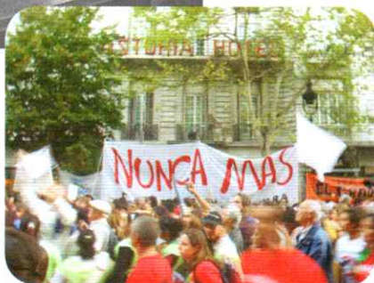
Marcha en el Día de la Memoria, la Verdad y la Justicia, donde se observa la consigna Nunca Más.