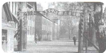
Entrada al campo de concentración y exterminio de Auschwitz, Polonia, dirigido por el nazismo.

La Convención para la Prevención y la Sanción del Delito de Genocidio es un documento aprobado por la ONU en 1948 y reconocido por la Argentina en 1956. Desde 1994 forma parte de nuestra Constitución Nacional.