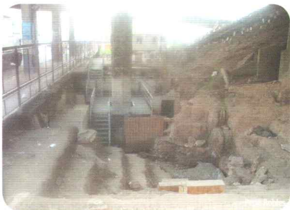
Excavación en busca de restos humanos en el ex centro clandestino de detención Club Atlético, Ciudad de Buenos Aires.