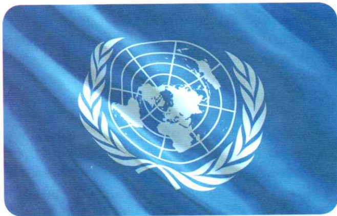
Bandera de la Organización de las Naciones Unidas.

El artículo 2 de la DUDH declara: "Toda persona tiene todos los derechos y libertades proclamados en esta Declaración, sin distinción alguna de raza, color, sexo, idioma, religión, opinión política o de cual-