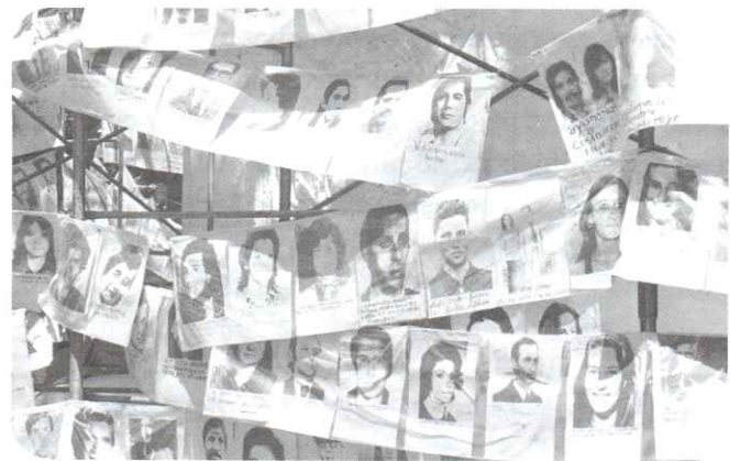
Manifestación en Plaza de Mayo en memoria de los desaparecidos durante la última dictadura militar.

Los militares, con apoyo de varios sectores civiles, sostenían que la sociedad argentina necesitaba ser “disciplinada” después de décadas de “desorden”. Consideraban que los gobiernos democráticos eran responsables por el avance de la demagogia (el arte de convencer al pueblo y utilizarlo para las propias ambiciones políticas) y la “subversión”. Este último término fue utilizado en un sentido muy amplio, tanto para designar a los integrantes de las organizaciones armadas como a cualquier persona que cuestionara el orden militar. Para disciplinar a la población, el gobierno militar organizó una durísima represión mediante bandas armadas que secuestraban a las personas y las encarcelaban en centros clandestinos de detención . Allí, los secuestrados eran sometidos a condiciones de vida infrahumana y a torturas. Las autoridades militares decidían el destino de los prisioneros: algunos eran liberados, otros eran trasladados a cárceles legales y muchos otros eran eliminados físicamente, pero se desconocía su paradero. Estos últimos pasaron a formar parte de la categoría de desaparecidos , ya que el Estado no brindaba información a sus familiares y nadie sabía qué había ocurrido con esas personas secuestradas. Esa falta de información era un efecto buscado por la dictadura para sembrar el pánico entre la población y evitar todo tipo de protestas.