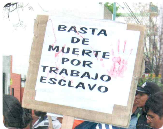
Marcha en contra del trabajo en condiciones de esclavitud en la Argentina.