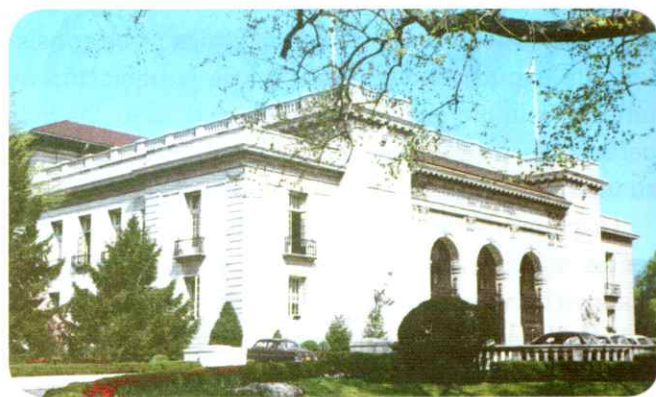
La sede principal de la OEA es en Washington, la capital de los Estados Unidos. Tiene representaciones y distintas oficinas en todos los países miembros.

¿Cuál es la función de la Corte Interamericana? Se trata de una institución judicial que vela por la aplicación e interpretación de la Convención Americana. Cuando un hecho de violación de derechos humanos reconocidos por esa Convención es presentado a la justicia del país donde ocurrió y no se resuelve satisfactoriamente, se puede acudir a la Comisión Interamericana de Derechos Humanos. Si la Comisión considera que el caso es admisible, lo transfiere a la Corte Interamericana para que investigue, juzgue y se expida.