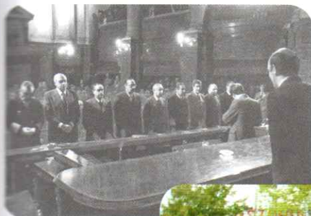
Veredicto final durante el juicio a las Juntas Militares.

A su vez, en la década de 1990, el movimiento de derechos humanos incorporó nuevos reclamos a su lucha. Aunque muchos organismos siguieron movilizándose por el “juicio y castigo a los culpables” por los crímenes de la dictadura, también apoyaron a otros grupos cuyos derechos humanos eran vulnerados. Según esta perspectiva, la desocupación, el crecimiento de las villas miseria, el hambre y la violencia policial en los barrios más pobres también deben ser entendidas como violaciones a derechos elementales.