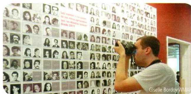
Mural con las fotografías de los padres y las madres de los nietos apropiados durante la dictadura, en la sede de Abuelas de Plaza de Mayo.

Durante esta etapa, todas estas organizaciones buscaron coordinar acciones y fortalecerse mutuamente. Ante las miles de detenciones y desapariciones se compartieron diversos actos públicos y se firmaron documentos, cartas abiertas y pronunciamientos en forma conjunta. Los organismos de derechos humanos reunían no solo a los afectados directos o a sus familias, sino a todos aquellos que no podían desempeñar sus actividades habituales en las organizaciones políticas o gremiales. Además, buscaron apoyo internacional en reclamo a los abusos de la dictadura. Las denuncias sobre los secuestros y desapariciones recibieron el apoyo de organismos extranjeros, como Amnesty International, y de los gobiernos de distintos países.