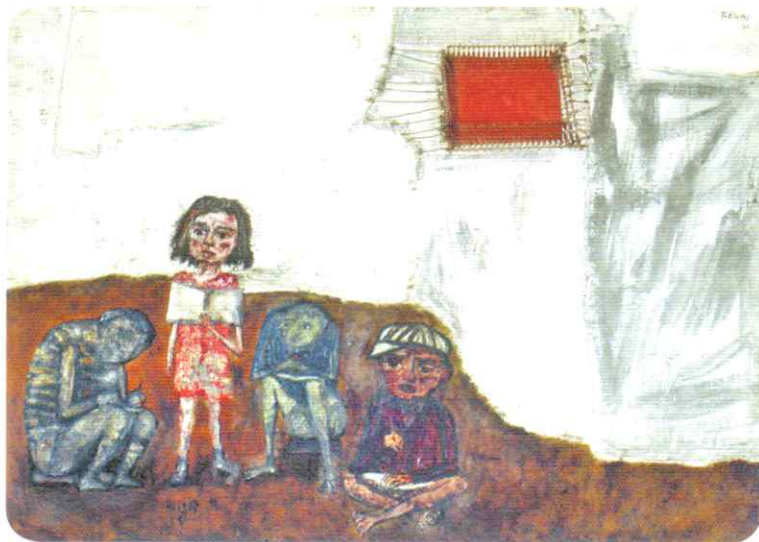
Juanito aprende a leer, 1961.

El artista plástico Antonio Berni (1905-1981) se caracterizó por la realización de obras de gran sensibilidad social que reflejaban las condiciones de vida de los sectores populares a través de diferentes estilos y técnicas. Juanito Laguna es uno de sus personajes.