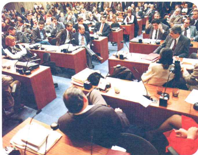
Sesiones durante la reforma de la Constitución Nacional mediante la cual se incorporaron tratados internacionales que protegen los derechos humanos.

En el ámbito del trabajo, las políticas neoliberales profundizaron el crecimiento de la inseguridad laboral , a través de la tercerización y la precarización laboral. En 1995, entre otras leyes que contradicen lo establecido por la Constitución, se promulgó la llamada Ley de Flexibilización Laboral , que habilitó a despedir y contratar, de acuerdo con distintas figuras precarias, a trabajadores, tanto en el ámbito público como privado. A partir de entonces, muchas personas en situación de pobreza se vieron obligadas a trabajar en muy malas condiciones, durante muchísimas horas y sin un salario justo.