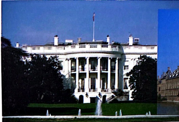
Casa Blanca, sede de la Presidencia de los Estados Unidos.

En este capítulo comenzamos el estudio del gobierno. Explicaremos su definición, sus perspectivas de análisis, las formas de gobierno y su evolución histórica. Luego, a través del concepto de gobernabilidad nos acercaremos al funcionamiento y efectividad de los gobiernos, y propondremos una reflexión sobre sus desafíos en la actualidad.