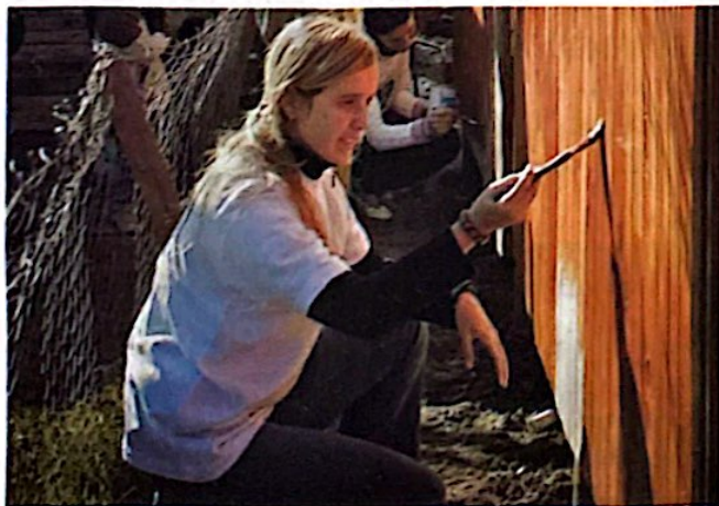
Grupo de integrantes de UTPMP en acción.

rantías, como la acción de amparo y el hábeas corpus , y todos los elementos necesarios para que no se vulneren derechos.