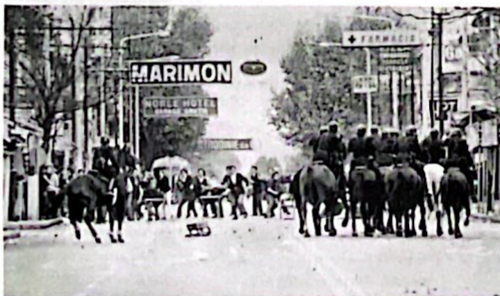
El gobierno autoritario de Onganía, durante la segunda mitad de la década de 1960, buscó asegurar la gobernabilidad reprimiendo la movilización social. En la foto, enfrentamiento durante el “Cordobazo” (1969).

Una de las características de los sistemas democráticos es que la ciudadanía tiene la posibilidad de organizarse para participar, expresar sus demandas y canalizarlas a través de diferentes medios. En consecuencia, una democracia suele generar mayor cantidad de demandas que un sistema autoritario; si las demandas son excesivas, se crea un contexto de ingovernabilidad. Una “solución” posible es contener las demandas y, para ello, disciplinar a la sociedad mediante la fuerza o los mecanismos ideológicos (como los medios de comunicación o la educación) para limitar la movilización ciudadana. En América Latina, ese tipo de “soluciones” ya se habían