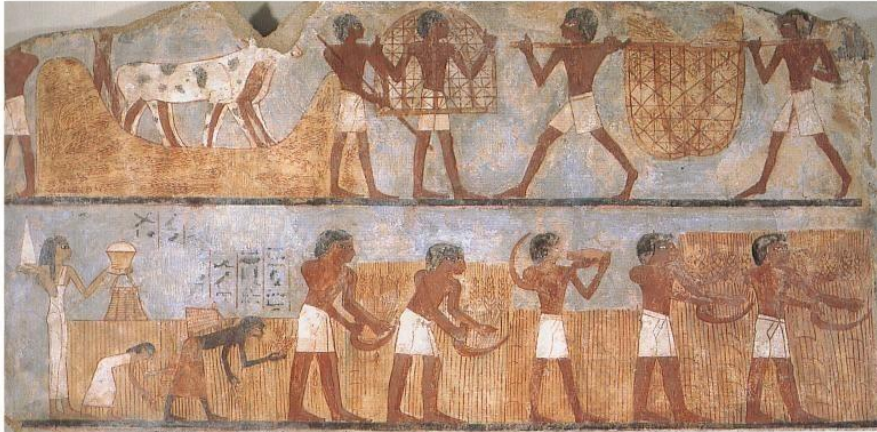
Los egipcios realizaron muchas innovaciones técnicas en la agricultura.

Para desarrollar la agricultura , su principal actividad económica, fue necesario controlar las crecidas del río Nilo. Así construyeron diques y canales para contener las aguas en las crecidas del río; también hicieron pozos y emplearon sistemas de riego para cuando escaseaban las lluvias.