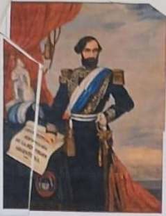
BARTOLOMÉ MITRE FUE EL PRIMER PRESIDENTE DE LAS PRESIDENCIAS HISTÓRICAS.