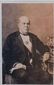
DOMINGO FAUSTINO SARMIENTO, SEGUNDO PRESIDENTE DE LAS PRESIDENCIAS HISTÓRICAS.